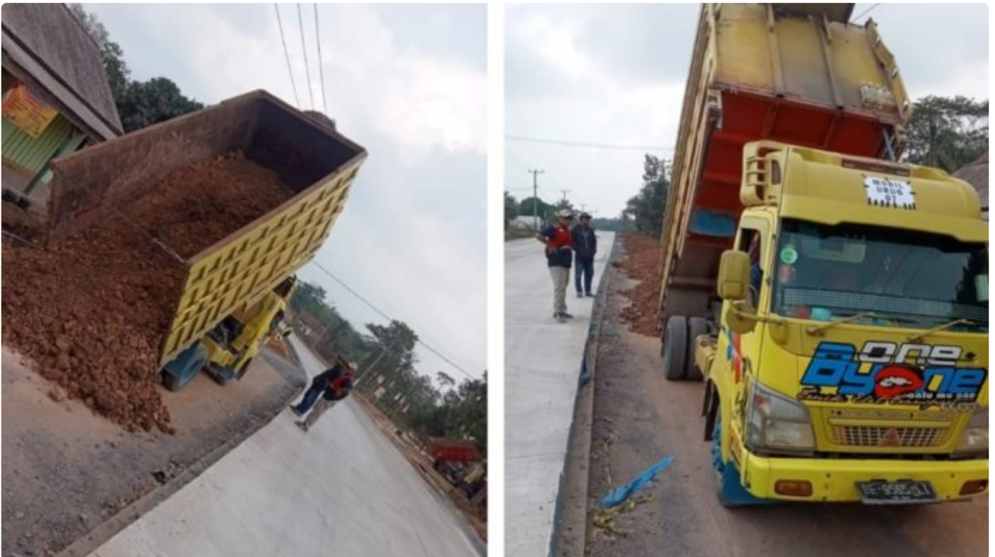
Mobil Pengangkut Tanah Galian C